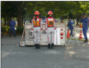
①院内放送と119番通報