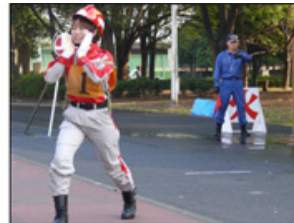
③患者さんの避難誘導